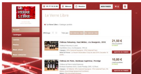
Site Internet du Verre Libre

« Ce qui m'a séduit dans l'offre PagesJaunes, c'est sa simplicité par son offre clé en main. On m'a proposé un site web qui fonctionne sur tablettes, à la fois efficace, rapide, et en plus très bien indexé dans les moteurs de recherche. Aujourd'hui, mes ventes sur le site représentent à peu près 20% de mon chiffre d'affaires. J'ai des ventes au niveau local et national. Sur eBay, les produits sont très bien référencés, et j'ai bénéficié de 3 mois offerts, ce qui représente un réel avantage économique ! »