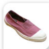
Ballerines élastiques Bensimon vieux rose, 22€*