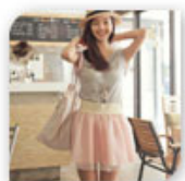
Robe 2 en 1 tee-shirt gris et jupe tutu rose pale ceinturée, 19,99€*