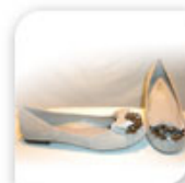
Ballerines bijou grises, 19€*