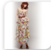
Robe longue légère à motifs fleuris, 15,99€*