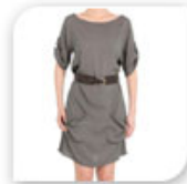
Robe esprit militaire kaki ceinturée, 39€*