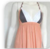
Robe corsail, taupe et blanche nouée derrière la nuque, 18,90€*