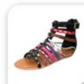
Spartiates montantes tressées, 19,90€*

*Prix indicatif constaté le 28 mars 2011.