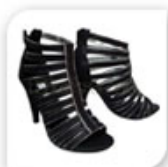
Sandales type spartiates, talon 7cm, 23,90€*