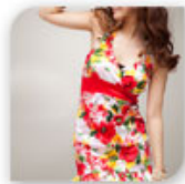
Robe courte cintrée à fleurs rouges, 19,99€*