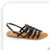
Indémoudables spartiates plates, 16,90€*