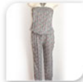
Combinaison bandeau légère liberty, 22,99€*