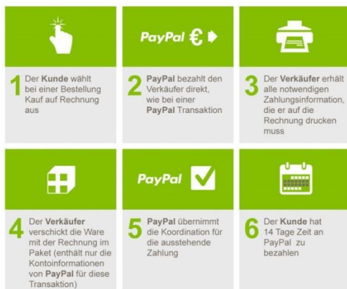
Abb.: Prozess Kauf auf Rechnung bei eBay